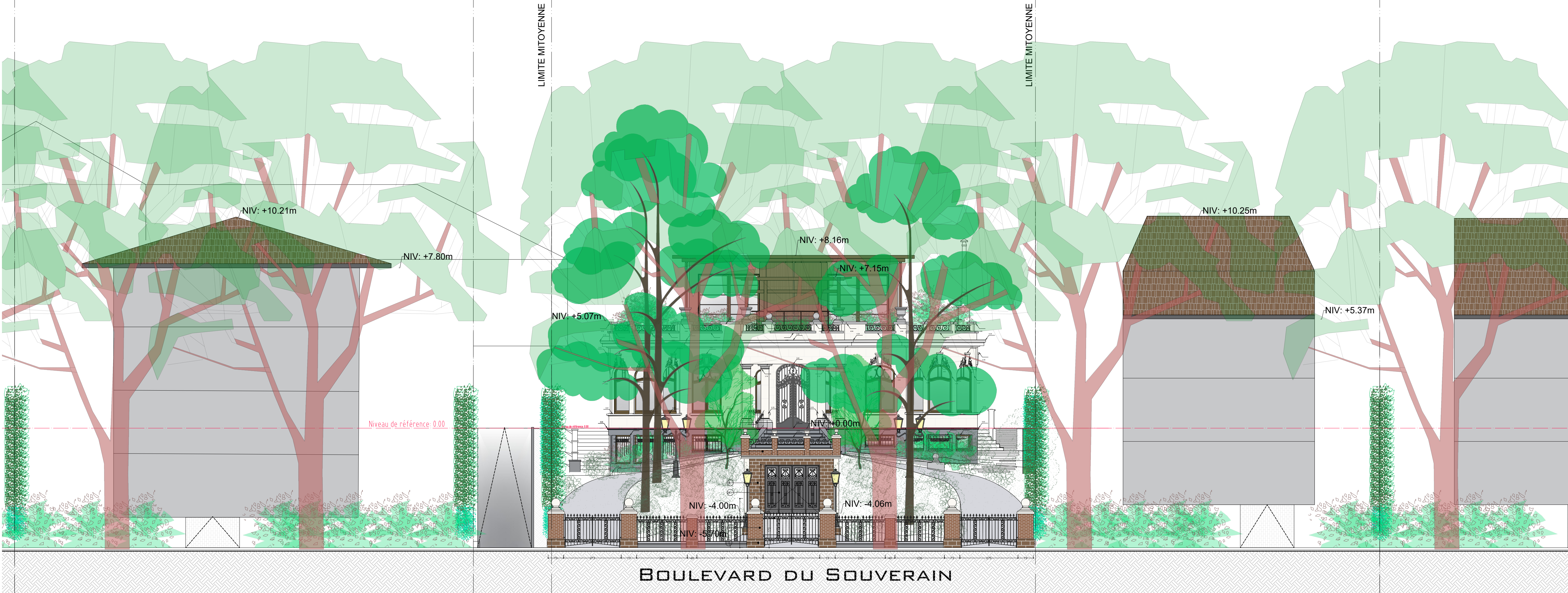
COUPE TRANSVERSALE RUE ECHELLE : 1/100